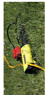
Aufnahmeapparaturen für unterschiedlichste Einsatzbereiche