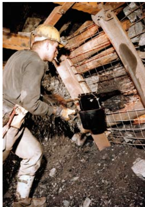
Testbohren - Erkennen einer Gebirgsschlaggefahr