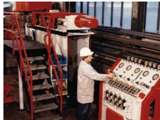
Scherprüfstand für eingebaute Gebirgsanker