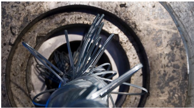
DMT Seilprüfung Zerreisstest